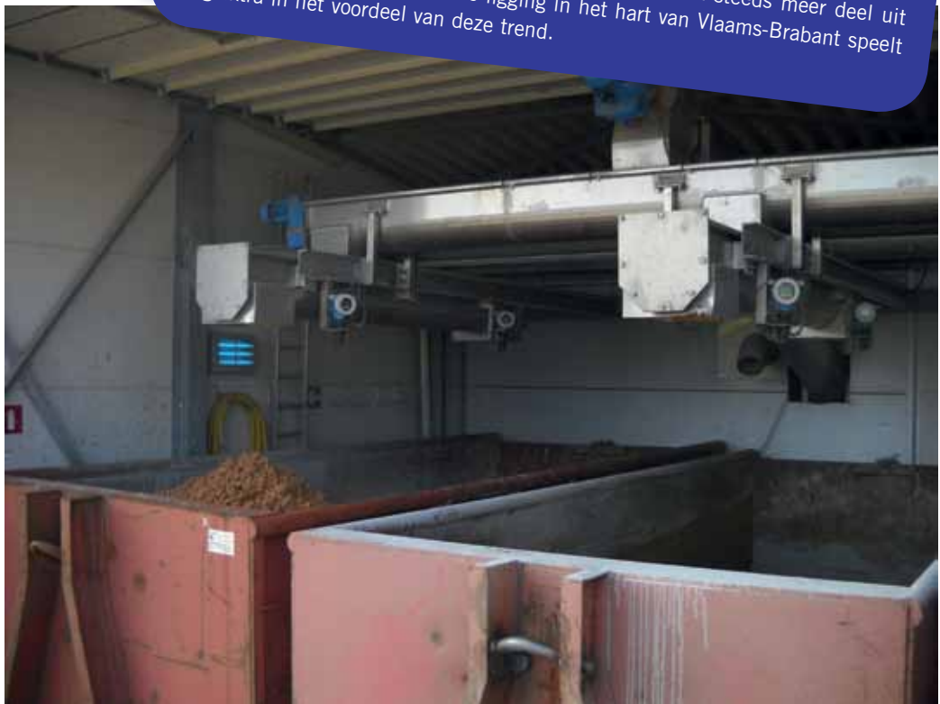
Een ergonomisch, efficiënt volautomatisch systeem voor het vullen van slibcontainers, met beperkte geuroverlast.

Enprotech, of Environmental Protection Technologies, opgericht in 1996, groeide gestaag tot een veertigtal ingenieurs en technici vandaag. Het bedrijf beheerst het volledige gamma van best beschikbare technologie die wordt toegepast in de afvalwaterzuivering en het hergebruik van gezuiverd water. Momenteel kan Enprotech praten op een 100-tal referenties in binnen- en buitenland, met een totale capaciteit van meer dan 2 miljoen inwoner equivalenten. De dienstverlening voor de klant behelst voorstudie, al dan niet ondersteund door haalbaarheidstesten, proces- en detailontwerp tot project management en sleutel-op-de-deur projectrealisatie. De laatste jaren maakt proces-technische uitbating van gerealiseerde of bestaande installaties ook steeds meer deel van het orderboekje. De centrale ligging in het hart van Vlaams-Brabant speelt nog extra in het voordeel van deze trend.